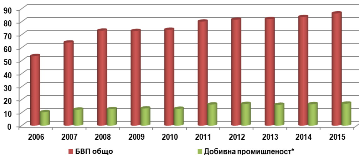
Фиг. 3 БВП на Република България, относителен дял на добивната и преработващата промишленост, разпределението на електрическа и топлинната енергия и другите горива през периода 2006-2015 година в млн. лв.

Забележка: *Добивната промишленост включва: преработващата промишленост; производството и разпределението на електрическа и топлинна енергия и на газообразни горива; доставянето на води; канализационните услуги, управлението на отпадъци и възстановяването.