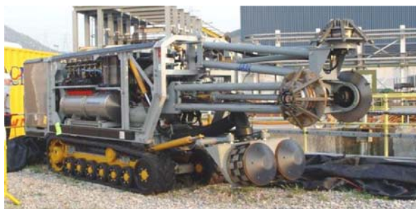
Фиг. 1. Земснаряд за подводен добив на ПИ

Морските минерали намиращи се на голяма дълбочина се оценяват като бъдещи източници на: