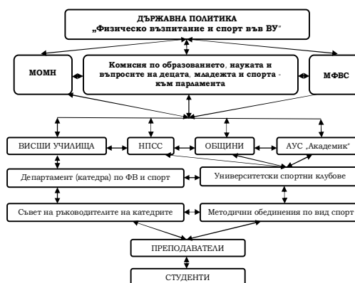
Фиг.1. Структура – държавна политика.

Във фиг. 1 даваме структурния анализ и функционалните връзки на взаимодействие между държавните структури и обществените спортни организации за управление на академичния спорт.