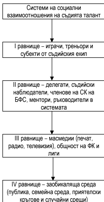
Фиг. 2. Равнища от социални отношения на талантливия съдия.

Умението да се постигнат оптимални резултати във взаимоотношенията си със заобикалящата ги среда, което зависи изключително от интелекта, общата ерудиция, характера и темперамента. Ние приемаме, че част от личностните качества са заложени с раждането, но едновременно с това те постоянно се изграждат в дадена професионална и социална среда (фиг. 2).