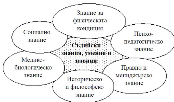
Фиг. 3. Компоненти на спортологичното знание при подготовката на талантливи съдии.

на системата на футболното съдийство. Компонентите на спортологичното знание при подготовката на млади футболни съдии е показано на фиг. 3.