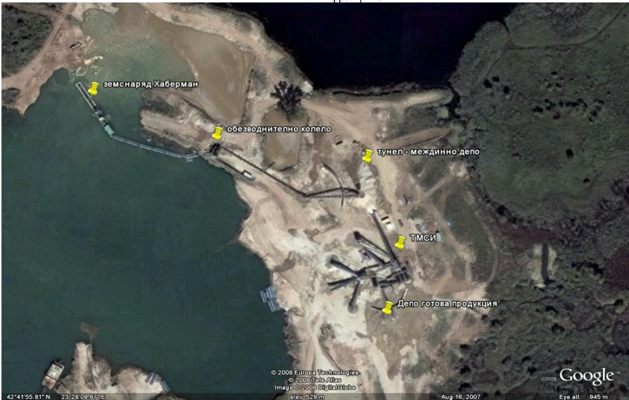
Фиг.2. Технологична схема на работа в находище „Кривина“

и четири спирални класификатора за обезводняване на фракция 0 – 4 mm.