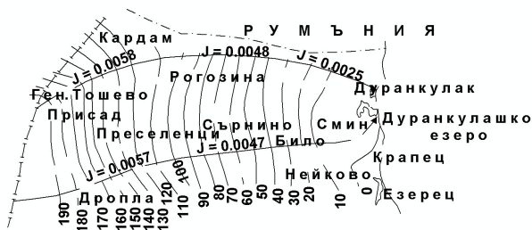
Схема с хидроизохипси на потока дрениращ се в Дуранкулашко езеро към 25.08.1994 г.