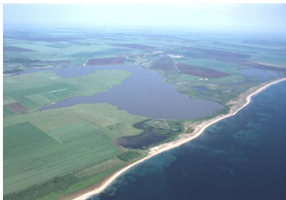
Фиг. 1. Дуранкулашкото езеро

Дуранкулашко езеро се намира в североизточната част на българското черноморско крайбрежие, в източната част на Югоизточна Добруджа, в землищата на селата Дуранкулак и Ваклино (фиг. 1-2). То е отделено от морето чрез пясъчна коса с ширина 100-200 m. Между южната и северната, наречена Орлово блато част на Дуранкулашко езеро съществува земнонасипна дига. Директният водообмен между двете части се осъществява само чрез прорязания в дигата канал.