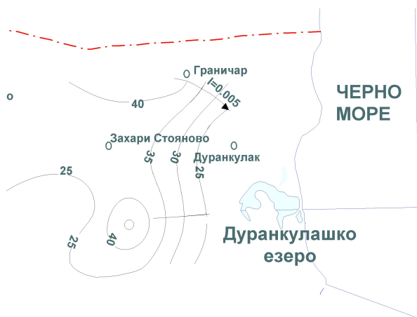
Карта с хидроизохипси на потока, дрениращ се в Дуранкулашко езеро към 7.08.2006 г.