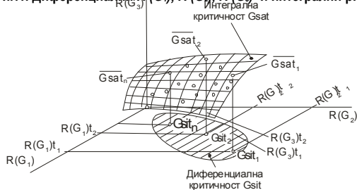
Фиг.1. Диференциални R(G_1), R(G_2), R(G_3) и интегрални рискове

Областта на текущите критични ситуации Gsit_1, Gsit_2, \dots, Gsit_n представлява диференциалната критичност Gsit .