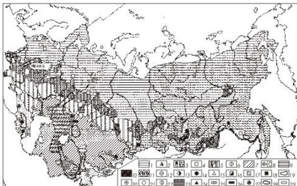
Фигура 1. Схематична карта на биохимично териториално деление на Русия и съседните страни [8] I - Биогеохимични зони (региони на биосферата) и зони области (зони подрегиони на биосферата).

въздействие са адекватни на клас незадоволителни условия на литосферните компоненти и екосистемната зона на криза. Екогеопатогенните системи от трето ниво съответстват на клас катастрофални условия на литосферните компоненти и екосистемната зона на бедствие.